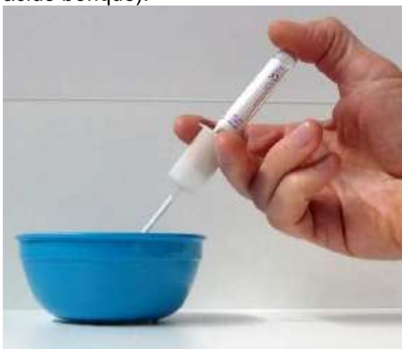
Avec canule de transfert

- Pour les services de soins : Transférer l'urine dans un tube vert olive à l'aide de la canule de transfert. Si volume < 5 mL : ne pas utiliser le tube olive mais un petit pot (sans acide borique).